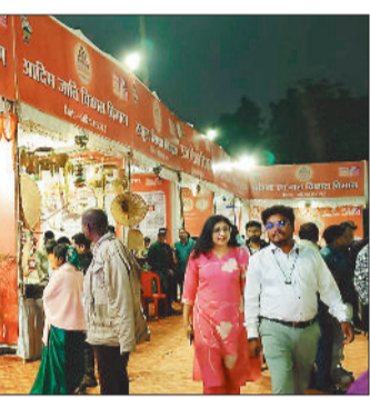
व स्वरोजगार के अवसरों में भी वृद्धि हुई है। ग्रामीणों, किसानों, महिलाओं, युवाओं और

जनता की सहभागिता अत्यंत महत्वपूर्ण रही है। स्वास्थ्य और शिक्षा सुविधाओं का विस्तार हुआ है। सड़क, बिजली, पानी एवं राशन की आपूर्ति सुदृढ़ हुई है तथा रोजगार