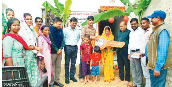
हरिभूमि न्यूज >>> सूरजपुर