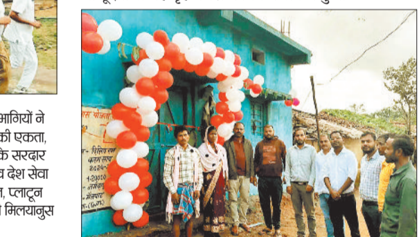
राज्योत्सव पर जिले के 14033 हितग्राहियों ने किया गृह प्रवेश

मैनपाट। छत्तीसगढ़ राज्य स्थापना के रजत जयंती अवसर पर प्रदेशभर में प्रधानमंत्री आवास योजना ग्रामीण अंतर्गत हितग्राहियों का सामूहिक गृह प्रवेश कार्यक्रम हार्मोल्लास के साथ संपन्न हुआ। राज्योत्सव स्थल राजधानी रायपुर में आयोजित राज्य स्तरीय मुख्य समारोह में प्रधानमंत्री नरेंद्र मोदी ने वर्चुअल माध्यम से छत्तीसगढ़ के हितग्राहियों का गृह प्रवेश कराया। मैनपाट ब्लॉक के 993 लाभार्थियों ने भी इस अवसर पर एक साथ अपने नए आवासों में प्रवेश किया। प्रधानमंत्री आवास योजना ग्रामीण के तहत राज्य में अब तक मैनपाट ब्लॉक के अंतर्गत 14477 से अधिक सर्वसुविधायुक्त आवासों का निर्माण कार्य पूर्ण किया जा चुका है। राज्य स्थापना दिवस के अवसर पर मैनपाट ब्लॉक में सामूहिक गृह प्रवेश कार्यक्रम आयोजित किया गया। कार्यक्रम के दौरान सभी नवनिर्मित घरों में रंगोली सजा, दीप प्रज्वलित कर पारंपरिक रीति से गृह प्रवेश किया गया। इस अवसर पर, लाभार्थियों को सम्मान पत्र, खुशियों की चाबी और स्मृति चिन्ह भेंट किए गए। इस दौरान पंचायतों में जनप्रतिनिधियों की उपस्थिति में ग्रामीण जन और उच्चाधिकारियों की मौजूदगी से यह गृह प्रवेश कार्यक्रम संपन्न हुआ।