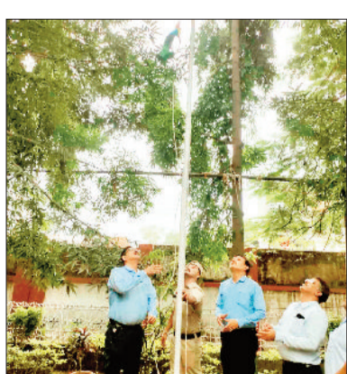
हरिभूमि न्यूज >>> विश्रामपुर