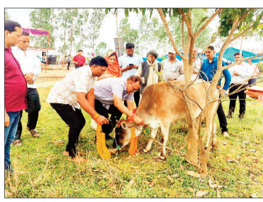
गौ-अष्टमी के दिन पूजा करते धाम के सदस्य।