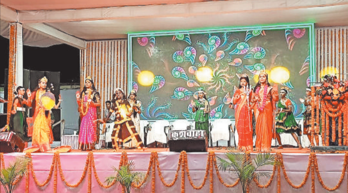
सांस्कृतिक कार्यक्रम की प्रस्तुति देते कलाकार।