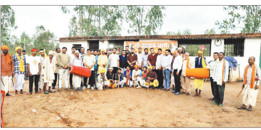
गौ आश्रय धाम में उपस्थित चार पंचायत के लोग।