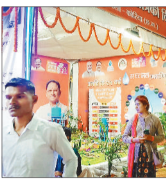
विभिन्न विभागों के स्टॉल

कहा कि कोरिया जिले में राज्योत्सव 2 से 4 नवंबर तक आयोजित किया जा रहा है, जिसमें जिले की विरासत, उपलब्धि और पहचान को जन-जन तक पहुंचाने पर