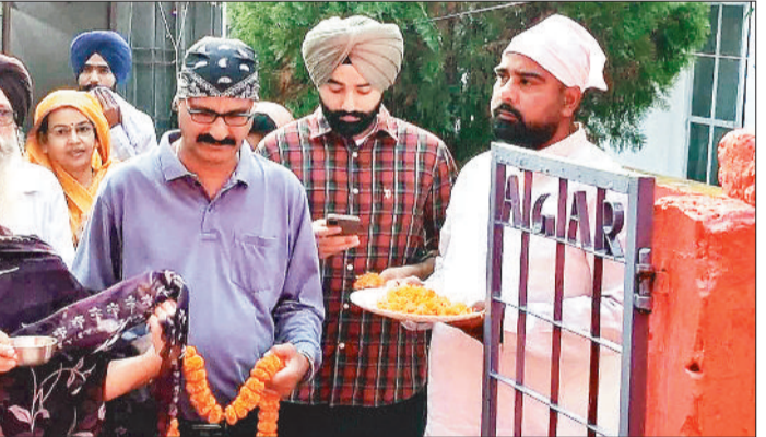
प्रकाश पर्व को लेकर शहर में निकली प्रभातफेरी।

नानक देव जी ने समाज को सच्चाई, एकता और भाईचारे का संदेश दिया। उनके उपदेश आज भी मानवता को सही दिशा प्रदान करते हैं। हमें उनके आदर्शों को जीवन में अपनाकर समाज में प्रेम, शांति और सद्भावना का वातावरण बनाना चाहिए। उन्होंने कहा कि ऐसे धार्मिक आयोजन समाज में सकारात्मक ऊर्जा और आपसी