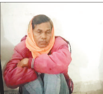
हिरासत में लिए गए लोग।

बच्चों के जीवन स्तर में उल्लेखनीय सुधार दर्ज किया गया है। | शेष पेज 4 पर