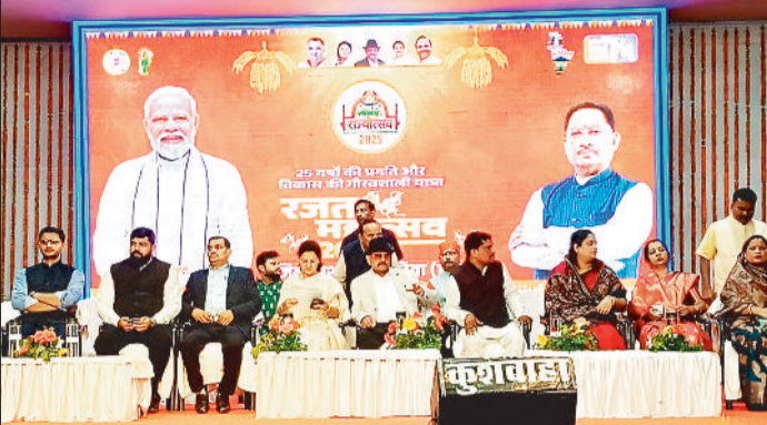
मंच पर अतिथि।